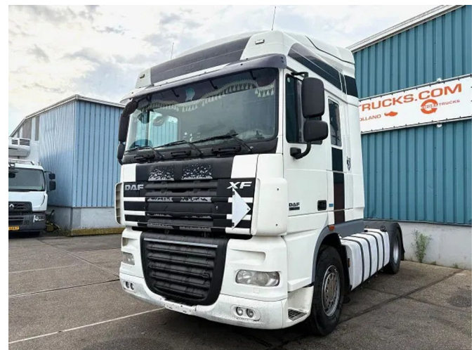
DAF XF 105.460 ATE SPACECAB (EURO 5 / ZF16 MA... 4x2