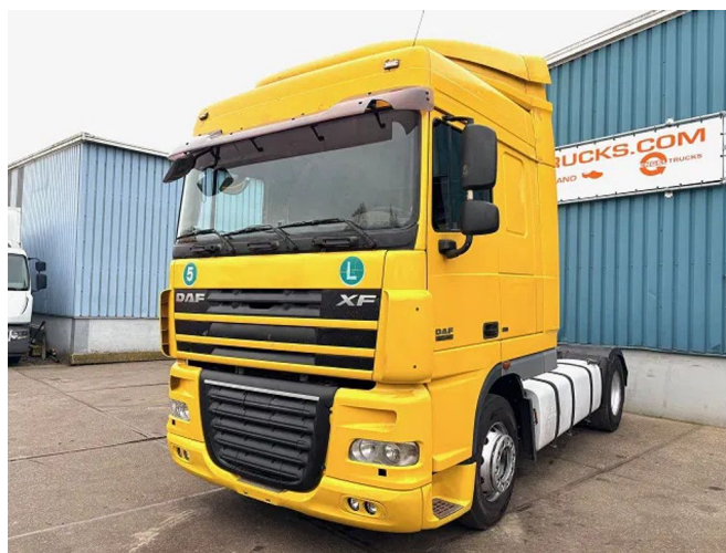
DAF XF 105.460 SPACECAB (EURO 5 / ZF16 MANUAL... 4x2