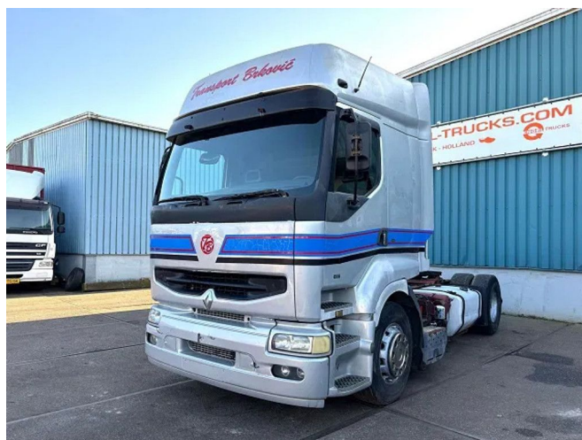
Renault Premium 400 .18T ROUTE 4x2 (POMPE MANUELLE...