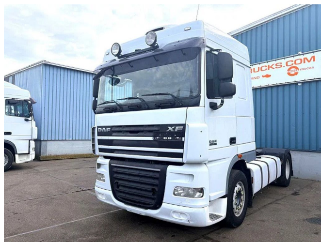
DAF XF 105.460 SPACECAB 4x2 (EURO 5 / AS-TRONIC / ZF...