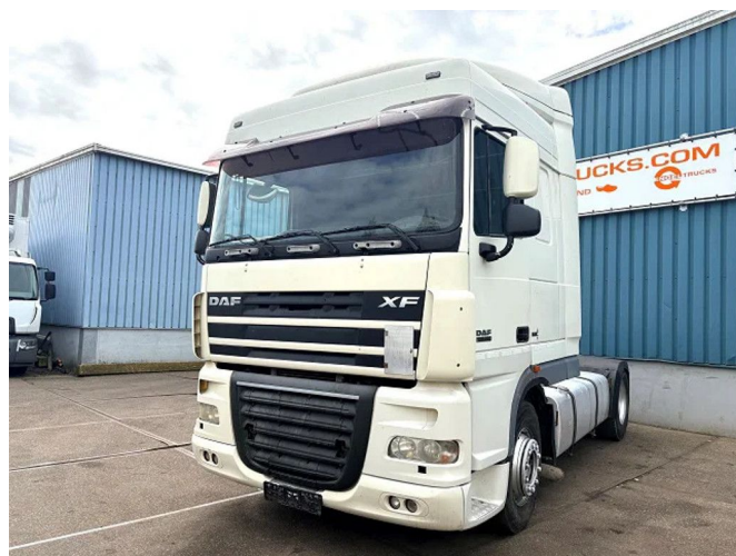
DAF XF 105.460 SPACECAB (EURO 5 / ZF16 MANUAL... 4x2