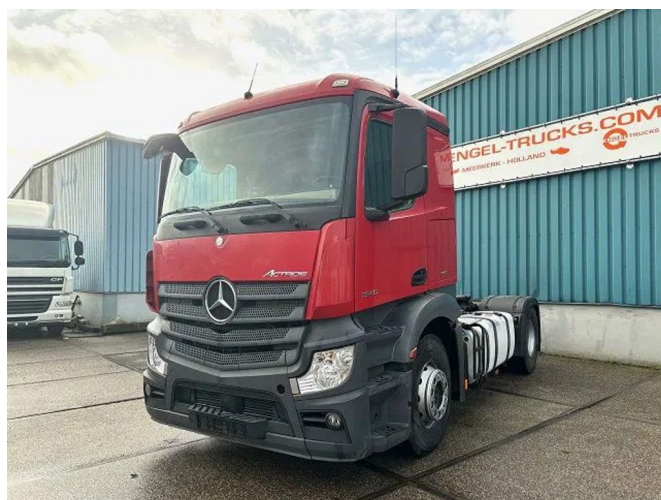
Mercedes-Benz Actros 1840 LS 4x2 SLEEPERCAB (6 IDENT... Referentienummer: SN 55955932