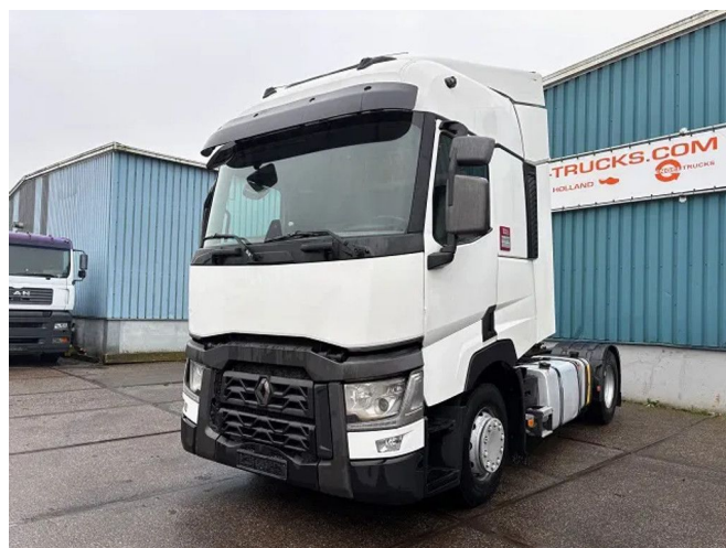
Renault T460 HIGH ROOF 4x2 (EURO 6 / AUTOMATIC GEA...